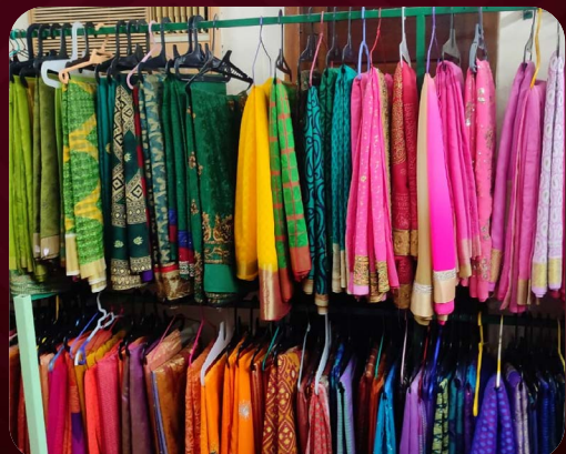
CLOTH BANK V/S FOODBANK Marymatha Ayurveda Hospital, Maradu, Poonithura, Ernakulam Mob: 94470 58165