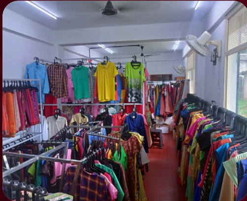
CLOTH AND TOY BANK V/S FOODBANK Thandilam, Vellattanjor , Thrissur 680601 Mob: 7594942225