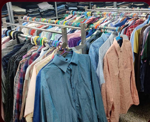
CLOTH BANK V/S FOODBANK City Park Building, Third floor, Vadakkenchery, Pin 678683, Mob: 9037428885