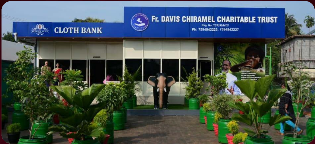
Fr. Davis Chiramel Charitable Trust Green Park, Koratty, Thrissur 680308, Mob: 7594942224